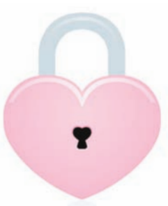
乐玛手工特色产品制作。