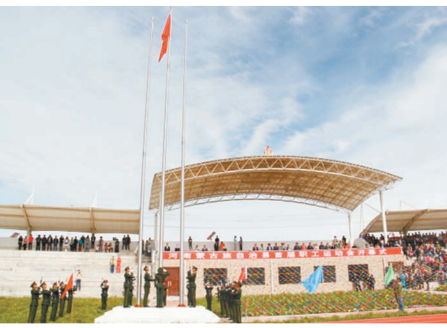
职工运动会开幕式。