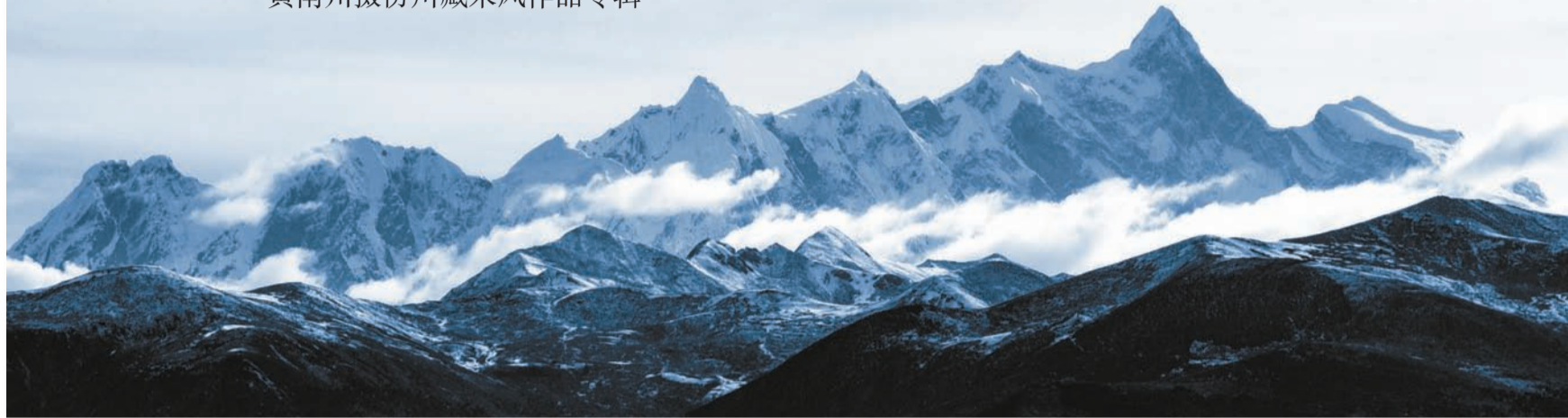
南迦巴瓦