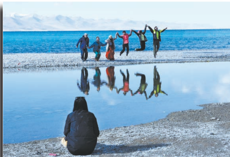
纳木措湖