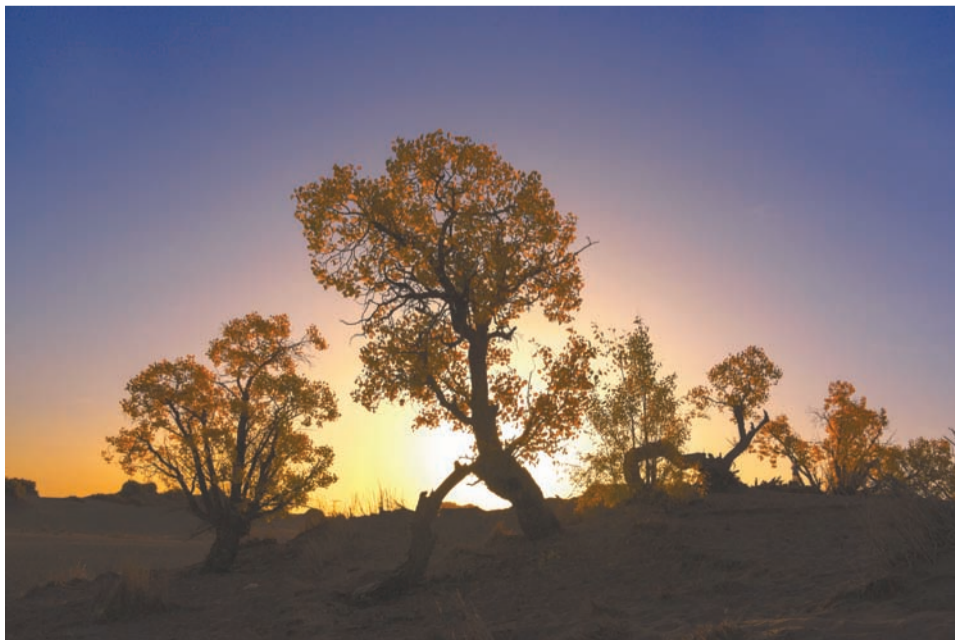
格尔木胡杨