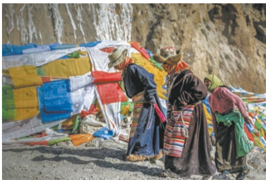
纳木措湖边的朝圣者