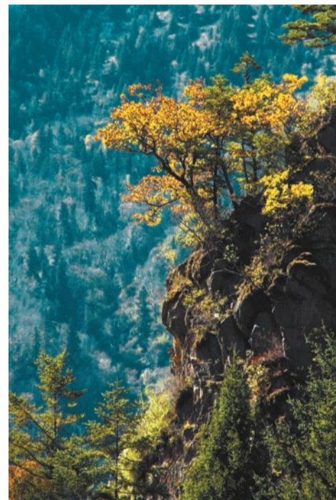
梭磨河谷