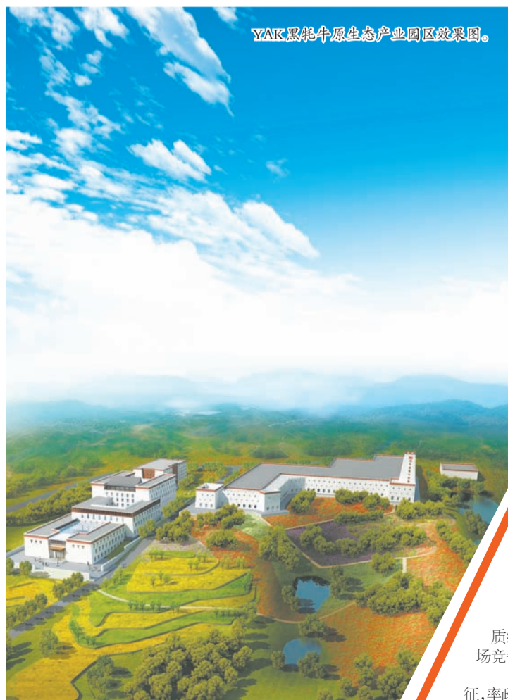
YAK黑牦牛原生态产业园区效果图。