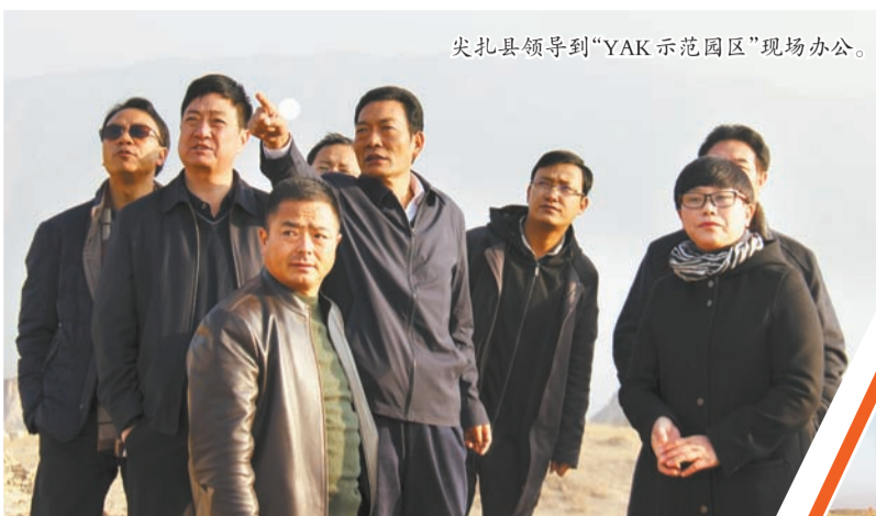
尖扎县领导到“YAK示范园区”现场办公。