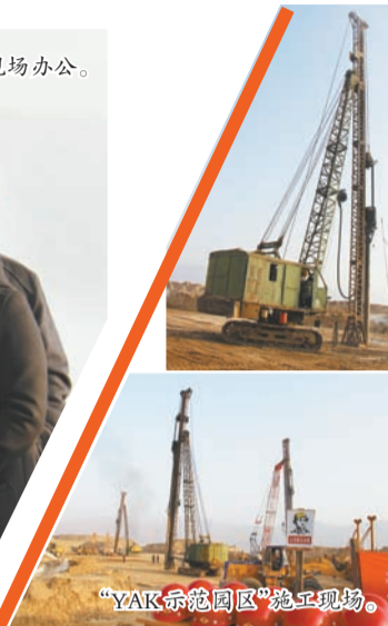
“YAK示范园区”施工现场。

在大美青海、灵秀尖扎有一支战队，他们做着“因青海而生，为中国而活”的牦牛梦，为圆这个梦，他们齐心协力、夜以继日、不辞辛劳，用实干精神让梦想照进现实！