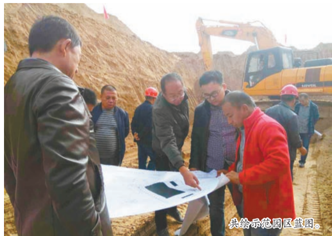
共绘示范园区蓝图。