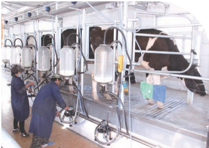
设备先进的挤奶大厅。