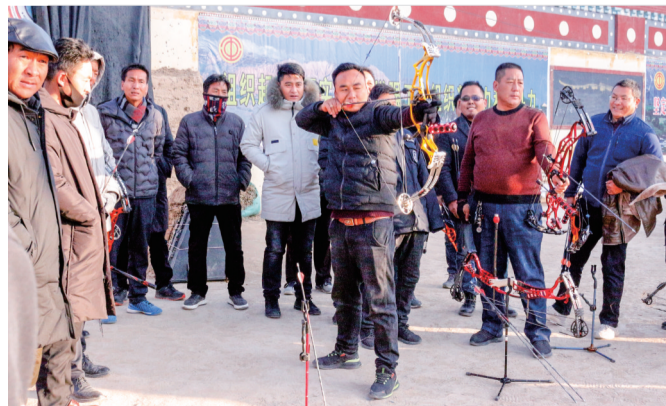
2019年12月30日,以“我运动,我健康”为主题的2019年度尖扎县职工传统射箭赛在五彩神箭射箭场举办,共有12支参赛队参加,进行了32场循环赛。