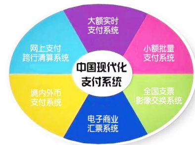
中国人民银行黄南州中心支行 2020年4月

网络不停,网银系统不止。我们网银系统的对外服务时间也是7天×24小时连续运行,全年无休。而且网银系统更加关注用户体验,人民银行与商业银行共同为用户提供“面对面”支付体验,网络和手机另一端的我们,账单资金跟大额一样也是实时到账的。至于资金在银行间如何处理就全部由网银系统按照规定动作默默处理啦!