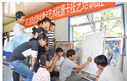
依托资源,强化培训,同仁市把培育热贡文化产业作为带动贫困群众增收的重要抓手。