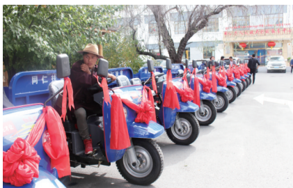
同仁市大力表彰脱贫光荣户,充分发挥脱贫光荣户的示范带头作用。