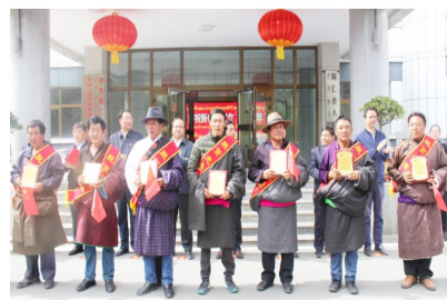
受到表彰的脱贫光荣户。

接到险情报警后,各成员单位迅速启动应急预案,火速组织人员、救援机械赶赴自然灾害现场。现场应急指挥小组根据险情结合各单位人员和装备,将抢险人员分为交通管制、应急救援、应急保障、抢险保通、医疗救护、专家技术六个组。演练现场,由州公安交警支队组成的交通管制组首先到达现场,按照预案中规定的演练科目及职责分工,设立安全警示标志、实施交通管制、车辆远端分流,进行现场警戒、维护现场周边秩序。在应急救援组排除现场火灾和山体滑坡隐患后进入现场开展现场勘查、协助人员救助、道路清障等科目的演练,按演练要求规范地完成了演练预案规定动作,做到各项处置措施落实迅速、各项救援工作有序开展。