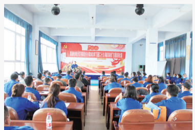
70余名员工观看比赛