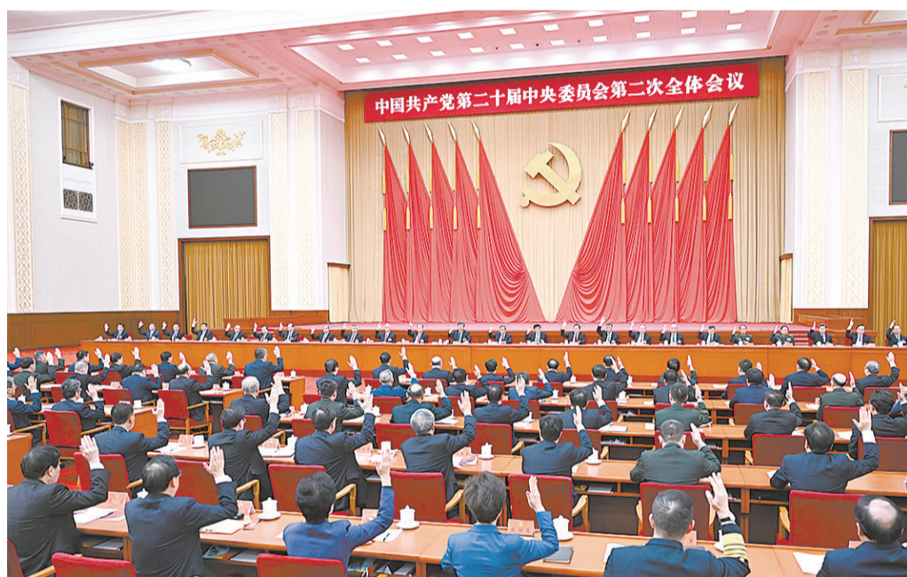
中国共产党第二十届中央委员会第二次全体会议,于2023年2月26日至28日在北京举行。中央政治局主持会议。